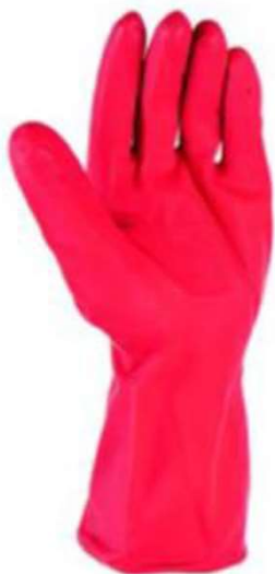
Guantes Domésticos de látex satinados. Contenido: 1 Par de Guantes