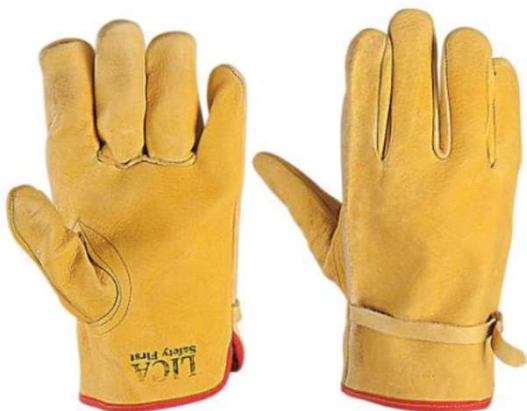
Guante Piel de Cerdo con ajuste 100% piel de cerdo.